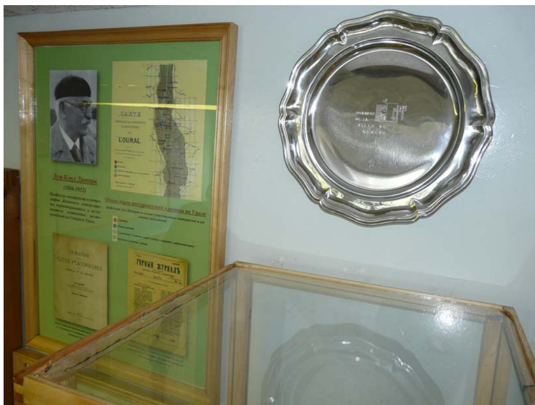
Au mur: plateau en étain, don d'honneur de la Ville de Genève.