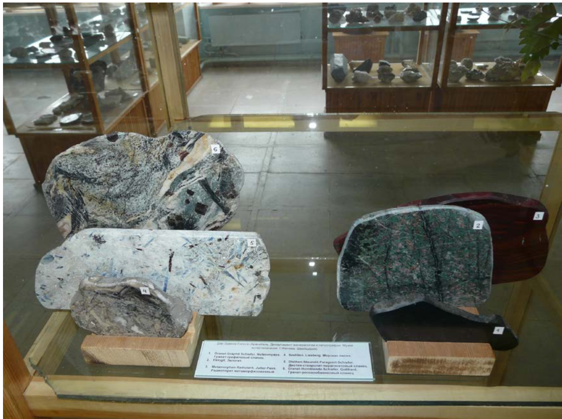
Schiste à grenats et graphite, col du Nufenen, TI-VS. Eclogite, Alpes, VS. Radiolarite métamorphique, col du Julier, GR. Lis de mer, Liesberg, BL. Schiste à kyanite, staurolite, paragonite, Pizzo Forno, TI. Schiste à grenat et hornblende, UR, Gotthard. Don de Edwin Gnos, conservateur de minéralogie MHNG, Genève.