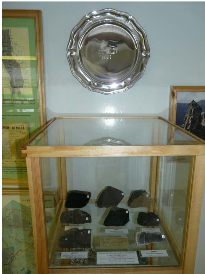
Roches décrites par L. Duparc et figurant sur ses cartes géologiques.