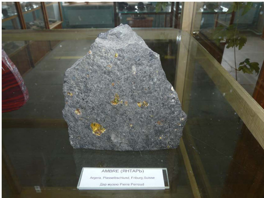
Ambre. Ärgera, Plasselschlund, FR, Suisse. Don de Pierre Perroud.