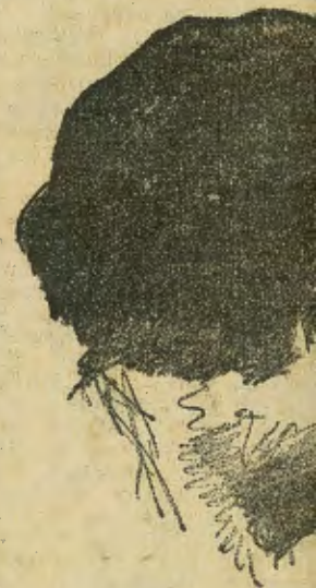
Mme Panthès inter (des